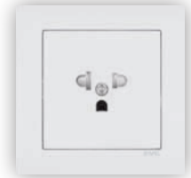
Prise Euro-Américaine avec Protection