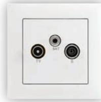
Prise R - TV - SAT Étoile