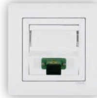
Prise de Fibre Optique SC APC Simplex