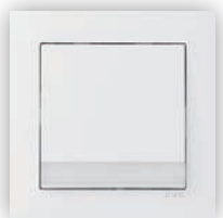
Poussoir à Bascule avec Identification