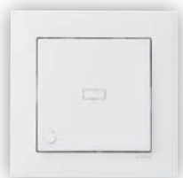
Poussoir à Bascule Lumineux