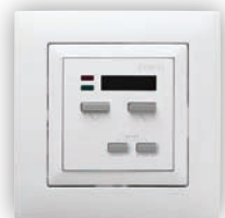
Commande Générale de Persienne avec Capteur IR