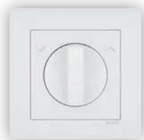
Va-et-Vient Rotatif de 16A