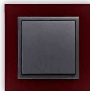
BS Intense Rouge/Gris