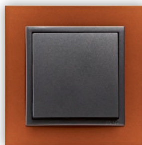
TS Intense Orange/Gris