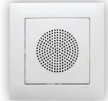
Haut-parleur de 2" - 32 Ohm