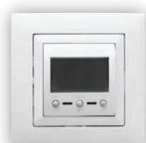
Thermostat avec Capteur IR