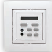
Commande de 1 Canal Stéréo avec FM, Réveil et IR