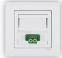
Prise de Fibre Optique LC Duplex