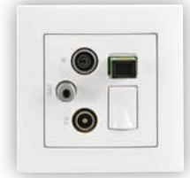
Prise Mixte R - TV - SAT - RJ45 Cat. 6 UTP - FO SC-APC Étoile