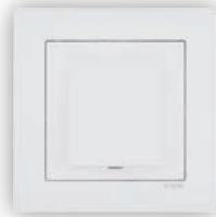
Rosette avec 4 Connecteurs