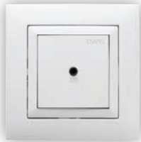
Centrale Modulaire de 1 Canal Stéréo