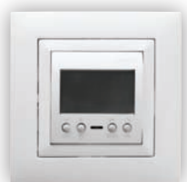
Interrupteur Horaire Digital 1 Circuit