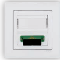
Prise de Fibre Optique SC APC Duplex