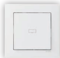
Interrupteur Bipolaire Témoin