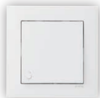
Poussoir à Bascule