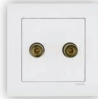
Prise pour Haut-parleur avec Terminaux de Vis