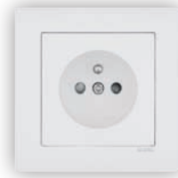
Prise de Courant Française avec Protection