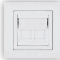
Prise Informatique RJ45 - 2 Sorties