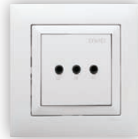
Module Auxiliaire de 3 Canaux Stéréo