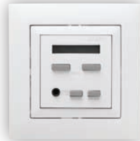
Centrale Modulaire de 1 Canal Stéréo avec FM