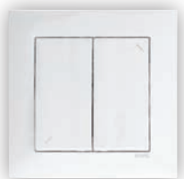
Poussoir Double de Persienne