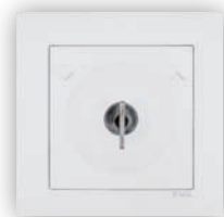
Va-et-Vient à Clé