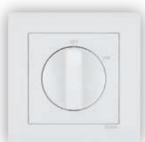
Interrupteur Rotatif de 16A