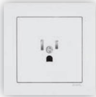
Prise Saoudite avec Protection