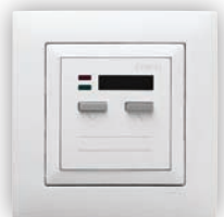
Commande Locale de Persienne avec Capteur IR