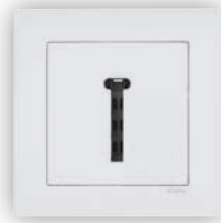
Prise de Téléphone Française T8