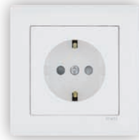
Prise de Courant Schuko avec Protection