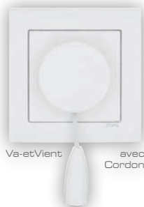
Va-et-Vient avec Cordon