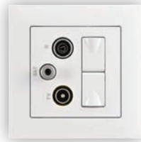
Prise Mixte R - TV - SAT - 2xRJ45 Cat. 6 UTP Étoile