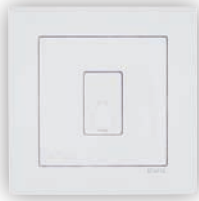
Prise de Téléphone