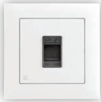
Prise Informatique RJ45 - 1 Sortie