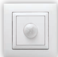
Détecteur de Mouvement