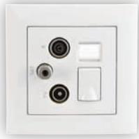
Prise Mixte R - TV - SAT - RJ45 Cat. 6 UTP Étoile