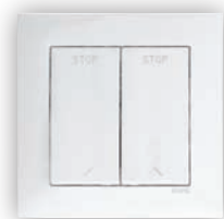
Inverseur de Persienne