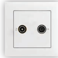
Prise R - TV Étoile