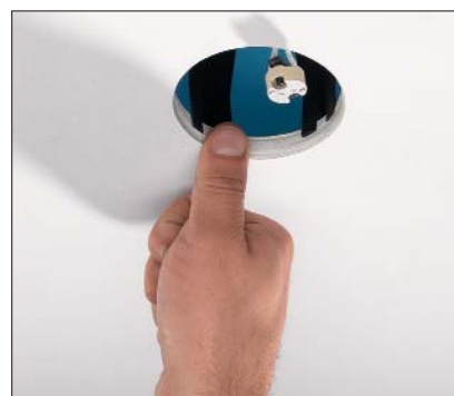
Enfoncer les ergots dans la plaque de plâtre pour prévenir tout désalignement ultérieur du système.