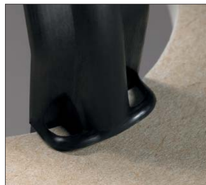
Des ailettes d'appui assurent la stabilité de l'ensemble.