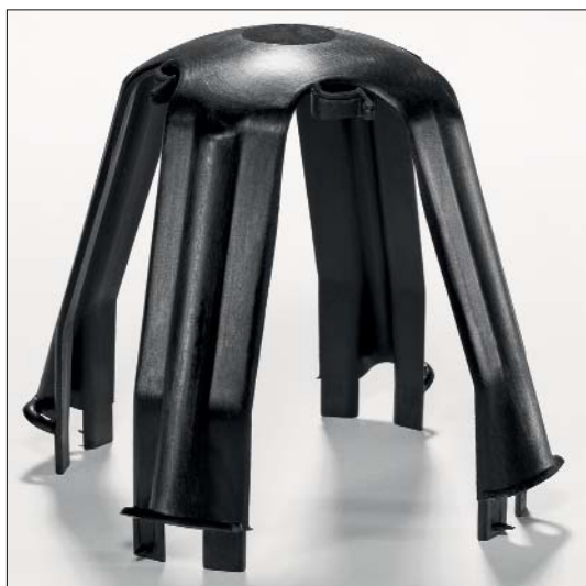
Le concept des 4 pieds assure la stabilité et le maintien fiable de l'installation.