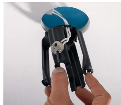
Fixer le fil, comprimer les pattes de montage et insérer dans l'ouverture au plafond.