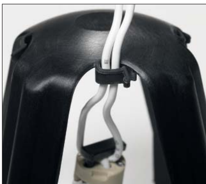
Les pattes de fixation des câbles sur la partie supérieure maintiennent le fil d'alimentation de la lampe.