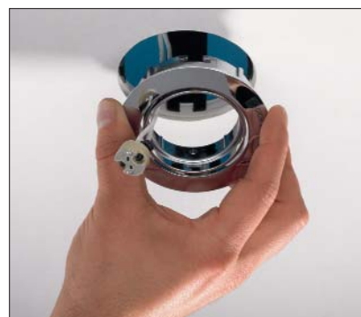
Installer la lampe selon la procédure habituelle.