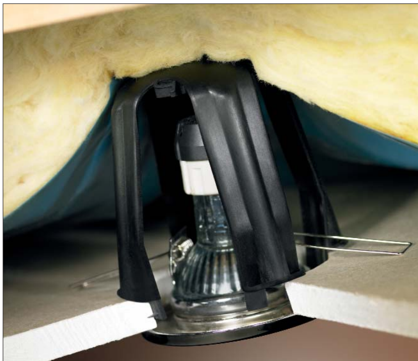
SpotClip assure un écart fiable à tous les endroits où la laine de verre doit être protégée de la chaleur.

SpotClip est un tout nouveau produit qui facilite l'installation de spots encastrables dans les faux plafonds. Utilisable aussi bien sur des panneaux de lambris que sur des plaques de plâtre, ce support protecteur à 4 pieds présente de nombreux avantages thermiques et mécaniques et peut même être ajouté ultérieurement à une installation existante. Il offre donc de multiples possibilités d'utilisation dans les domaines de la rénovation et de la construction. SpotClip assure le maintien d'un écart fiable entre la lampe et la laine isolante. Il réduit ainsi les risques que les matériaux isolants soient endommagés par surchauffe ou accumulation de chaleur. Il permet de plus d'augmenter la durée de vie du système d'éclairage.