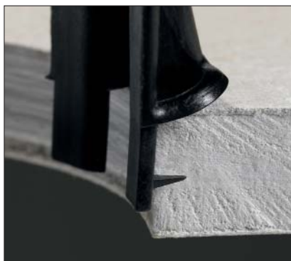
Des ergots permettent le maintien du SpotClip lors de l'installation de la lampe.