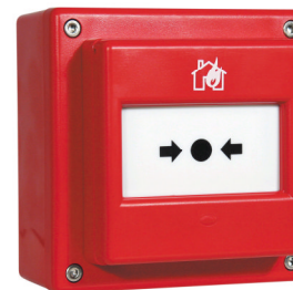
DMMD ET Rouge