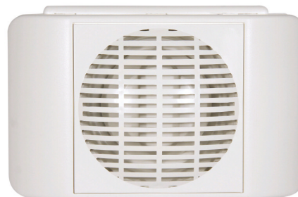
DSC T4 CODE : 534 104