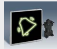
Touche lumineuse avec filtre « Sonnette » 82066 -31