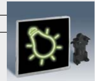
Touche lumineuse avec filtre « Lumière » 82066 -30

Utilisez 1 de ces 2 mécanismes pour toutes les touches.