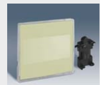
Touche lumineuse avec filtre neutre 82066 -32*

*Différentes options de filtres disponibles